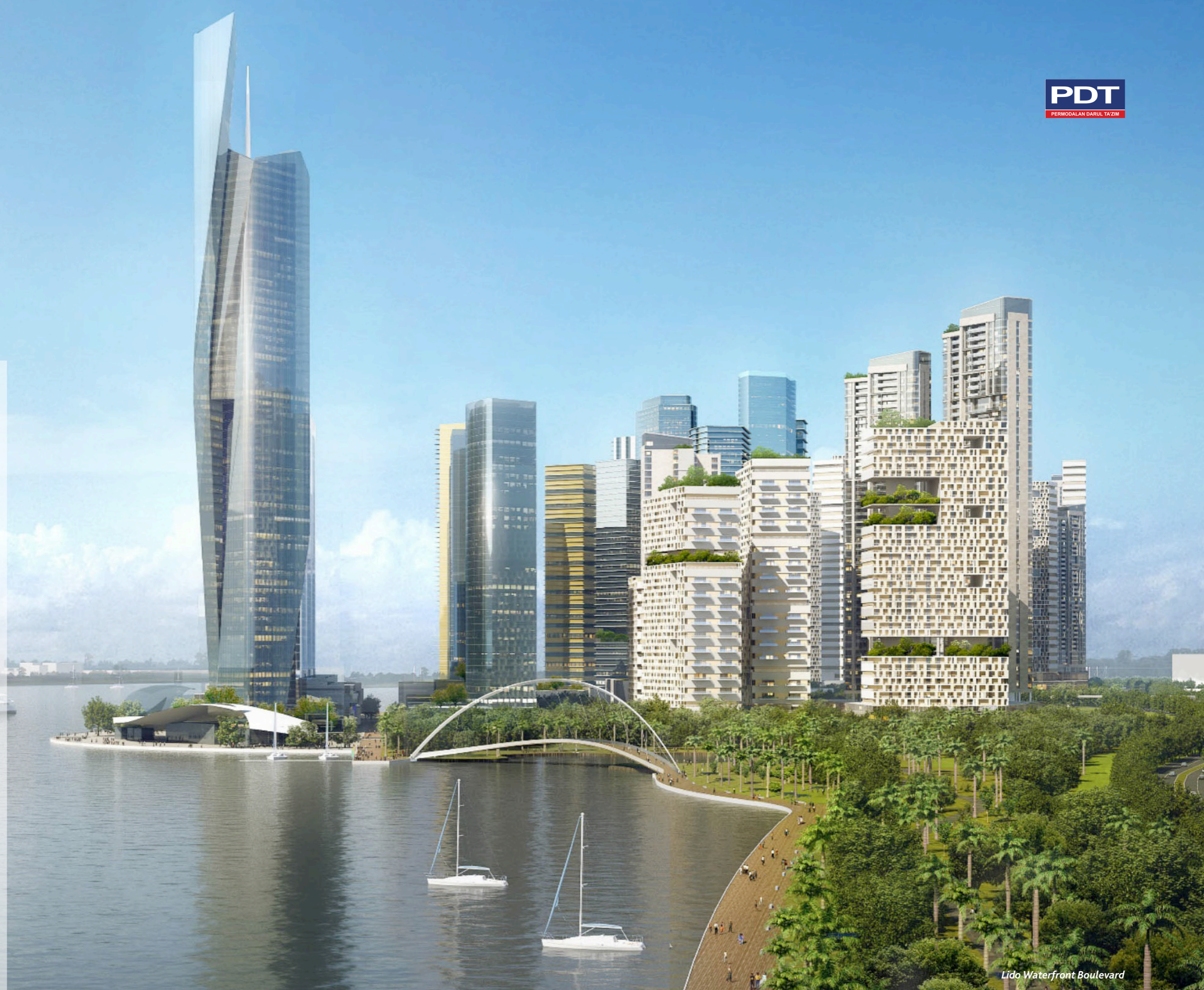
Lido Waterfront Boulevard